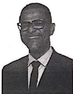
Prof. Bittencourt Vereador - PC do B