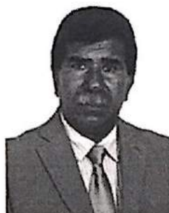
Bigode do Santa Maria Vereador - MDB